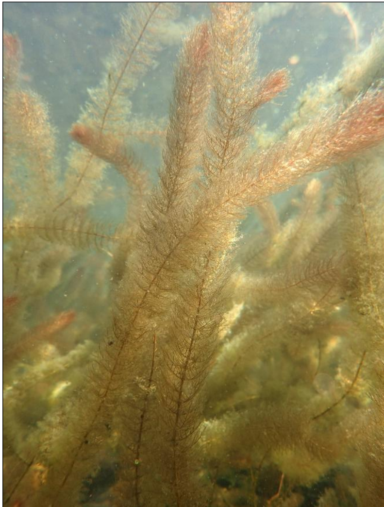
Ruskoarviää Järvelän suunnalla