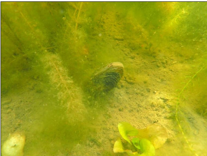
Pikkujärvisimpukka järven koillisosassa

Eläviä pikkujärvisimpukoita tuli harauslinjoilta yhteensä 9.